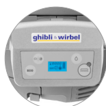
Commande panneau muni d'écran