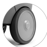
Roues antitraçe avec un grand diamètre