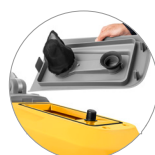
Couvercle amovible + flotteur + filtre protection moteur