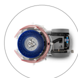
Système d'essuyage compact : séchage parfait même dans les virages