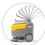
Manche réglable et inclinable