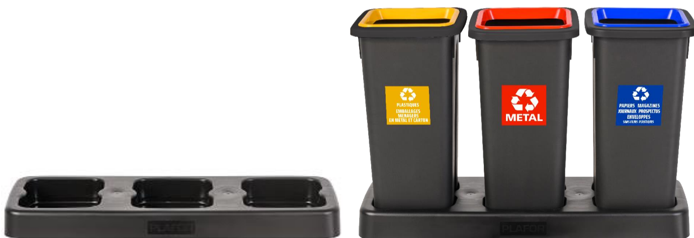
exemple de mise en situation

Base plastique noire pour poubelle FIT 20L