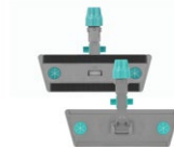
Support Velook avec Block System