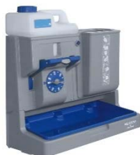
Système de dosage EQUODOSE Réf. 07310100UA