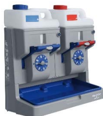
Système de dosage EQUODOSE double Réf. 07310200UA