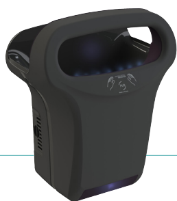
REF 8 11 1376 Exp'air automatique noir époxy UL 1 : 1