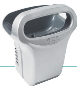
REF 8 11 822 Exp'air automatique alu gris époxy UL 1 : 1