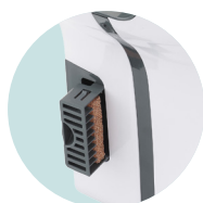
HYGIÉNIQUE FILTRE CUIVRE BACTÉRICIDE ET RÉSERVOIR D'EAU INTÉGRÉS, TRAITEMENT ANTIBACTÉRIEN DES SURFACES

+ REF 5 90 2014 Filtre cuivre Bactéricide UL 1 : 1