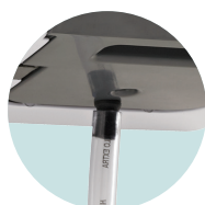
ÉVACUATION DIRECTE RACCORDEMENT AU TOUT A L'ÉGOUT POSSIBLE GRÂCE AU KIT ÉVACUATEUR INCLUS