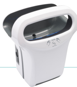
REF 8 11 791 Exp'air automatique alu blanc époxy UL 1 : 1

+ REF 5 90 2014 Filtre cuivre Bactéricide UL 1 : 1